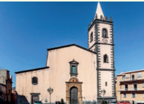
3. Chiesa dell'Annunziata