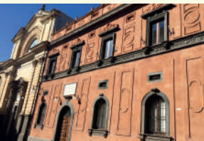
6. Real Collegio Capizzi