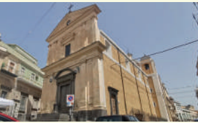
5. Chiesa del Rosario