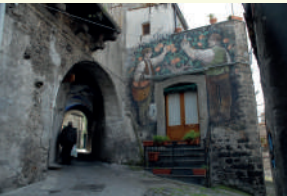
4. Il Catoio