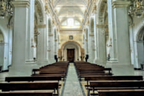
2. Chiesa della SS. Trinità